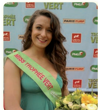
3 ème Etape : Vannes, 2 Mai