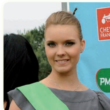
5 ème Etape : Langon, 30 Mai