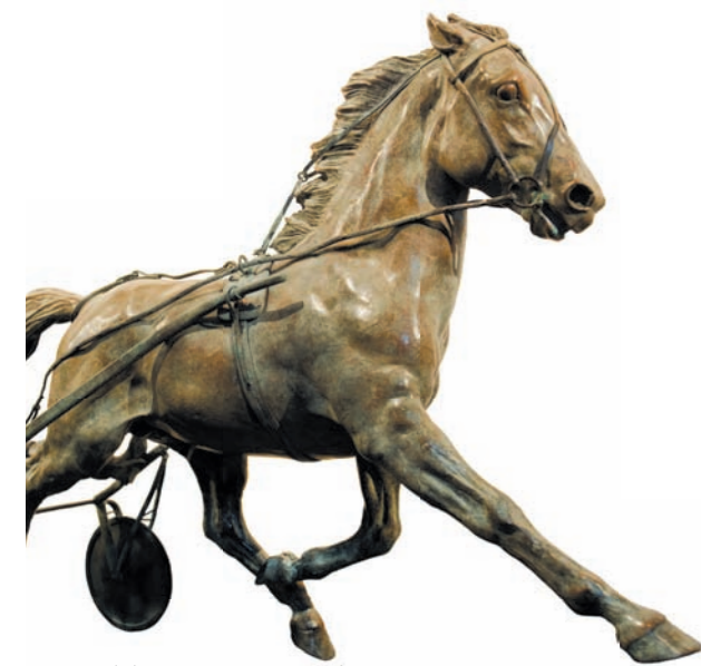
Frédéric Jager (1957) - Trotteur attelé - Bronze (circa 2000)

Première nation au monde en matière de trot, la France ne possédait pas de musée à la gloire de cette discipline sportive. Le 2 juin 2010, le Cheval Français a inauguré le plus important musée d'Europe consacré aux trotteurs.