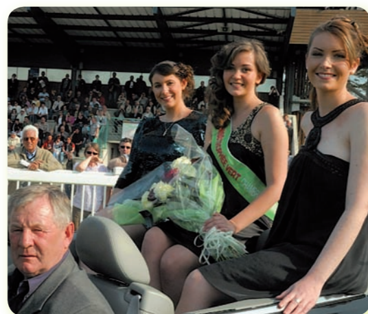
2 ème Etape : Tours, 18 Avril