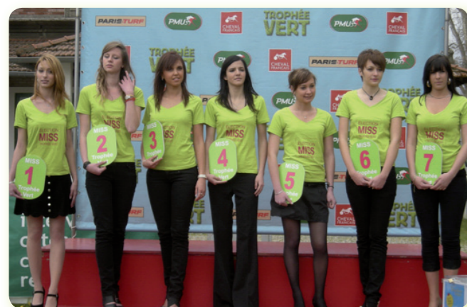
1 ère Etape : Avignon, 3 Avril

Le Trophée Vert, c'est quatorze étapes parmi les plus belles pistes en herbe de l'Hexagone. À chaque étape, l'élection d'une Miss. Chacune des élues régionales viendra concourir pour le titre de Miss Hippodrome 2011, le dimanche 26 septembre sur l'hippodrome Paris-Vincennes.