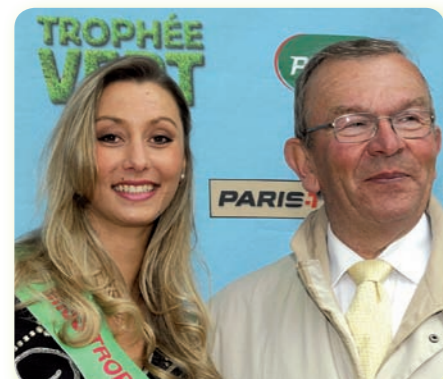
4 ème Etape : Rambouillet, 13 Mai